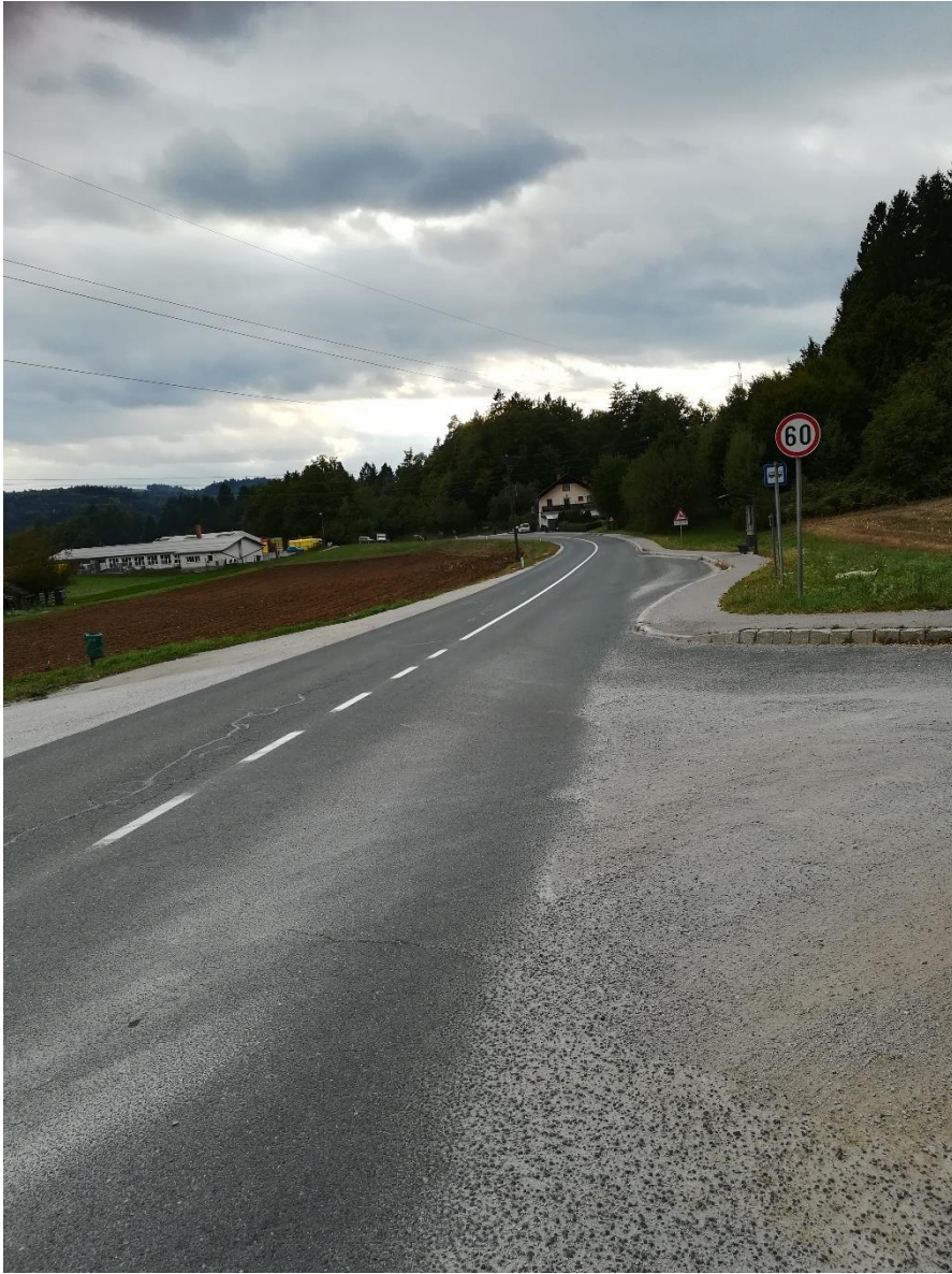
Postajališče Žaga (ni prehoda)