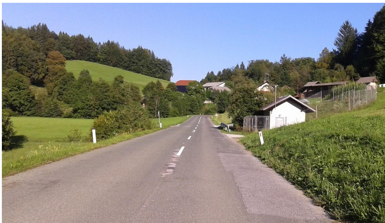
Gora pri Pečah, avtobusna postaja (na vozišču, ni prehoda za pešce, ni pločnika ali ustrezno urejene bankine)