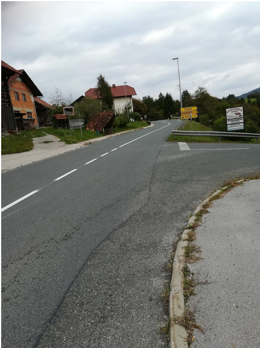
Postajališče Selo pri Moravčah (ni prehoda)