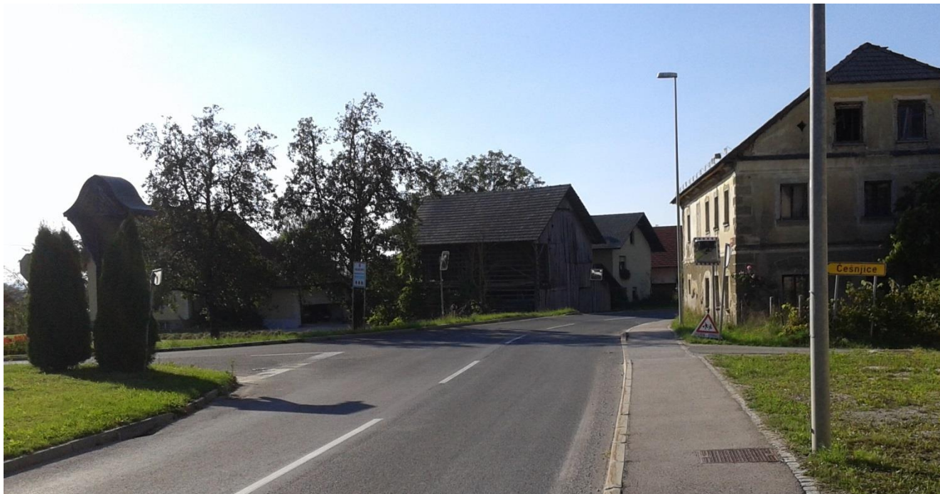
Križišče Česnjice (ni prehoda za pešce)