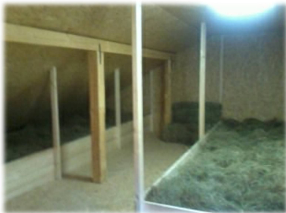
Slika 15: Ležišča v eko hotelu Pr'Oslet