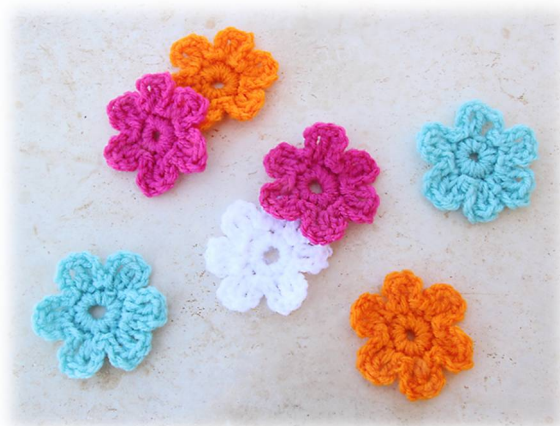
Slika 26: Osnovna kvačkana rožica

Po delavnici se bomo ponovno razdelili v dve skupini, prva se bo odpeljala do kmetije Pr' Matčk, katere glavna dejavnost je pridelava in predelava jabolk, druga skupina pa na kmetijo Kocjančič, katere glavna dejavnost je pridelava in predelava mleka.