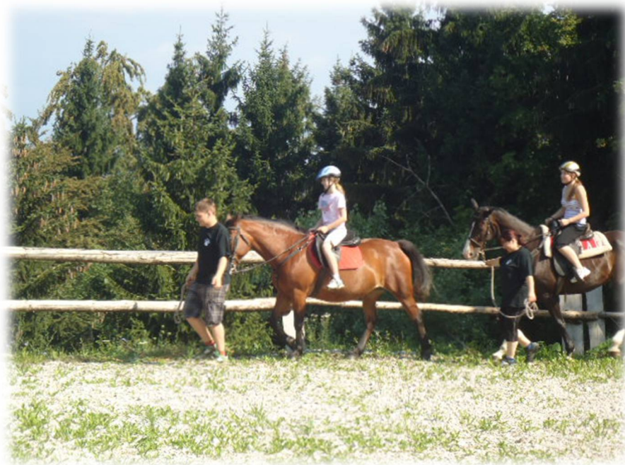
Slika 17: Jahanje konj