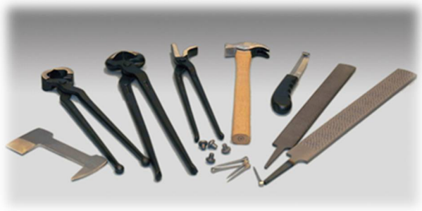
Slika 9: Orodje za podkovanje konja

Če imaš doma konje, ki jih je potrebno podkovati, je praktično, da imaš kovača in kovačijo blizu, najbolje kar doma. Sandi je tudi podkovaški mojster, tako da nam bo z veseljem razložil in pokazal, kako se podkuje konja. Včasih so se fantje igrali tudi s podkvami, metali so jih okoli palice, v tem se bomo preizkusili tudi mi.