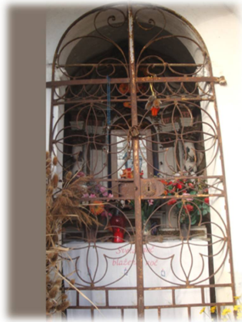
Sliki 5 in 6: Kapelica pod Stražo z vrtljivim oltarjem