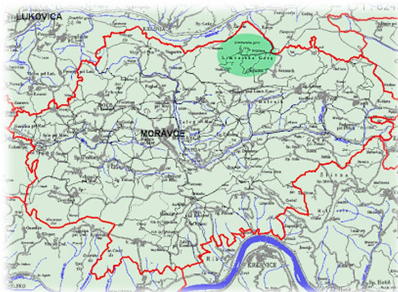
Slika 1: Zemljevid Moravške občine

Naše goste bo sprejela lokalna turistična vodička in jim predstavila kraj in njegove glavne znamenitosti.