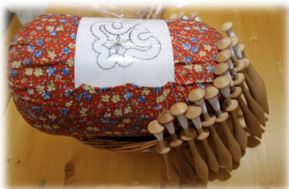
Slika 23: Bula in kleklji

Da so bile čipke že od nekdaj priljubljene, se vidi po tem, da so jih naše babice in prababice šivale na svoje narodne noše in bile zelo ponosne na ta okras. Dragocene čipke so večkrat krasile oltarje in kipe v cerkvah, ker so jih s tem hoteli še bolj počastiti. Po gradovih pa so plemiške žene in hčere izdelovale čipke za okras oblek, ovratnikov, manšet, pokrival za glavo, nogavic, čevljev, pajčolanov, pahljač in za okraske pri naslonjačih, kar še dandanes vidimo na slikah plemičev in drugih bogatinov. Pripomočki za klekljanje čipk so: blazina, kleklji, sukanec, nerjaveče bucike, kvačka in papirc, na katerem je bila s svinčnikom narisana čipka.