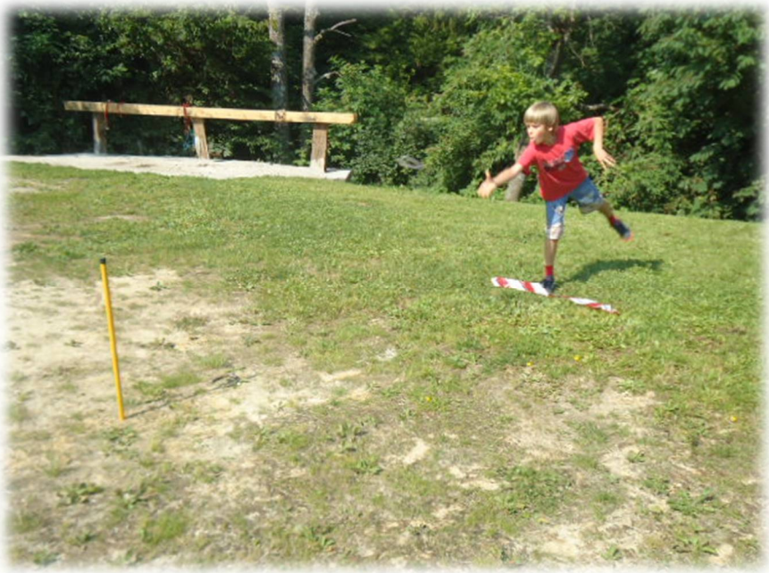
Sliki 11 in 12: Igra, metanje podkve