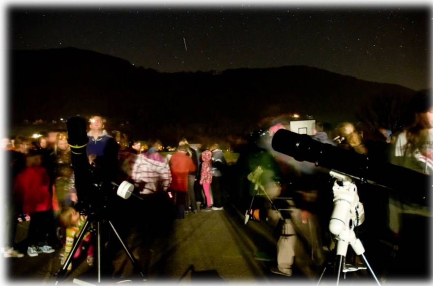
Slika 13: Ogled nočnega neba skozi teleskop