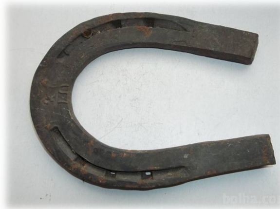
Slika 10: Konjska podkev