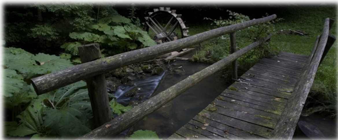
Slika 40: Mostič čez Račo, manjše mlinsko kolo