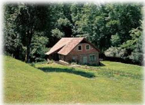
Slika 41: Mohorjev mlin na Rači