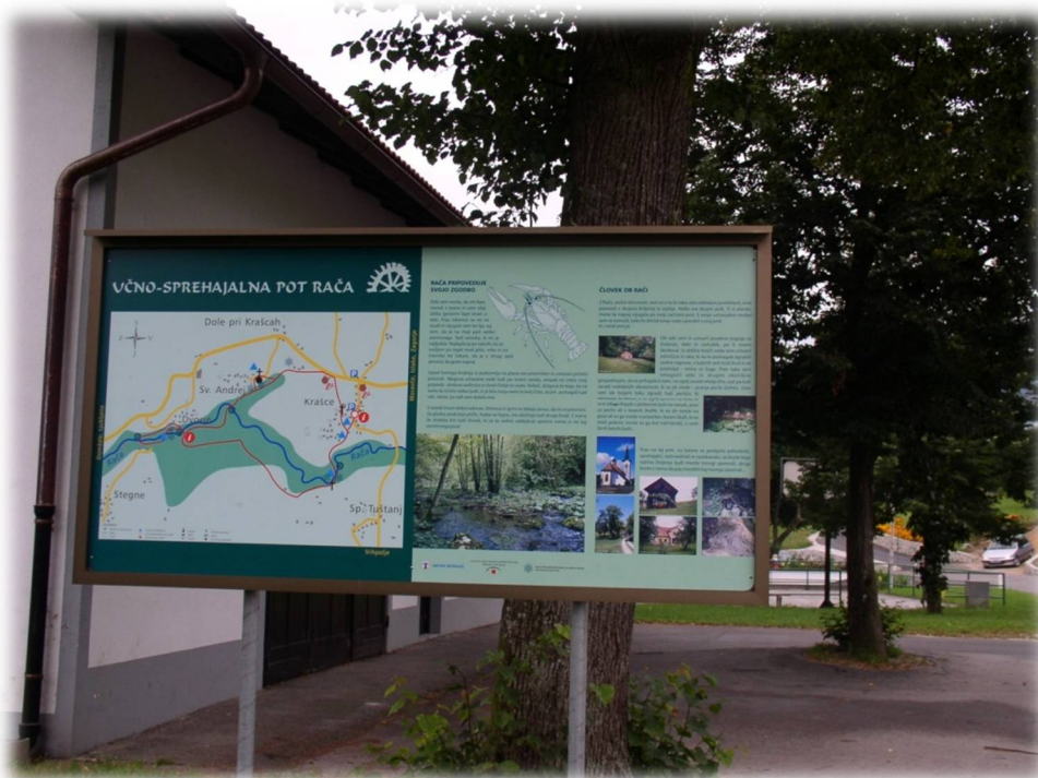
Slika 39: Tabla učno-sprehajalne poti Rača

primerna mesta ob Rači preuredili v perišča, ki še danes kljubujejo naravi in spominjajo na čas pred pralnimi stroji.