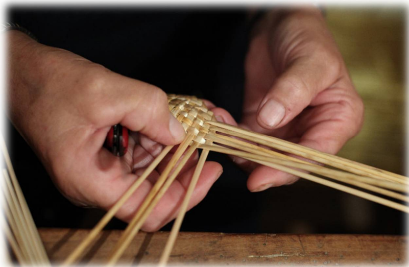
Slika 7: Pletenje slamnate kite

Danes tovarne slamnikov ni več, ostalo je le še par spretnih rokodelcev, ki ohranjajo starodavno tradicijo.