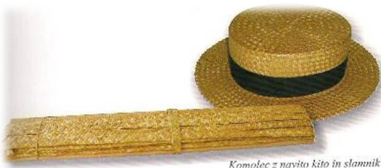
Slika 8: Polizdelek, kita, navita na "komolec", ter končni izdelek, slamnik