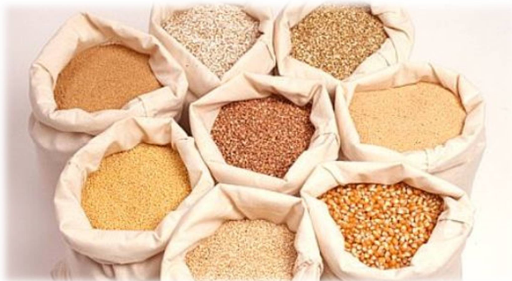
Slika 20: Različne vrste žit

Ogledali si bomo tradicionalno in sodobno proizvodnjo, po želji tudi kupili kakšno merico domače mlete moke ali kaše.