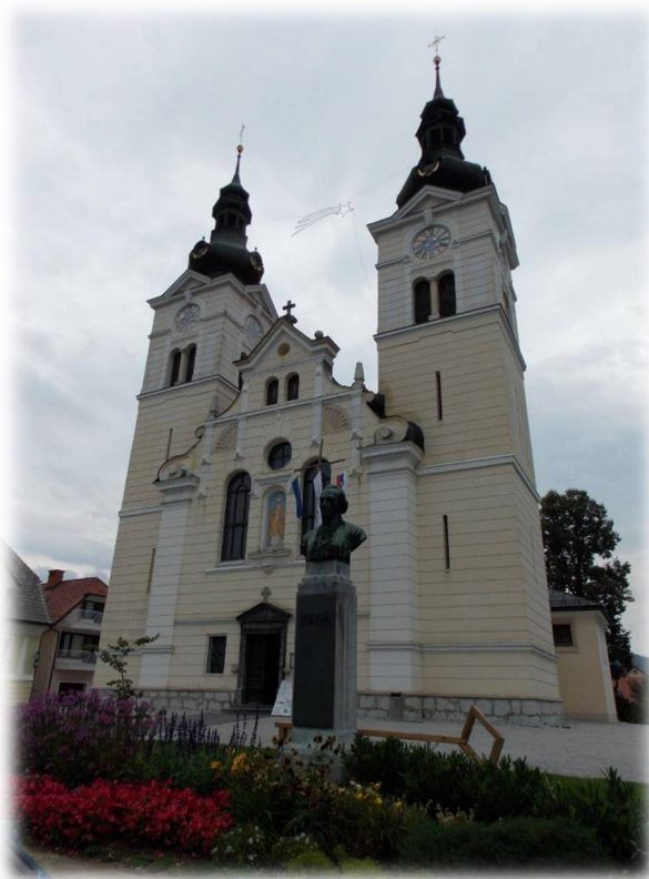
Slika 3: Pogled na cerkev Sv. Martina in doprsni kip Jurija Vege v parku pred njo