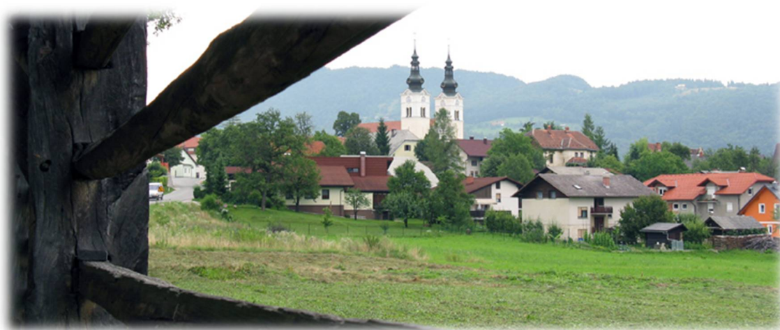
Slika 2: Pogled na center Moravč

Moravška dolina leži v neposredni bližini geometričnega središča Slovenije, ki je na Spodnji Slivni pri Vačah, ter na obronkih hribovja Limbarske gore in Sv. Mohorja na severu in južnim pobočjem Ciclja, Murovice in Javoršice. Od glavnega mesta države, Ljubljane, je oddaljena slabih 30 km. Na 61 km 2 in v 49 naseljih živi blizu 5.000 prebivalcev, ki si svoj kos kruha služijo predvsem z delom v sosednjih industrijskih središčih. Nekaj prebivalcev še obdeluje zemljo na številnih majhnih kmetijah, v zadnjem času pa se vse več kmetij ukvarja z dopolnilnimi dejavnostmi. Poleg občinskega središča sestavljajo občino krajevne skupnosti Moravče, Peče, Vrhpolje, Dešen in Velika vas.