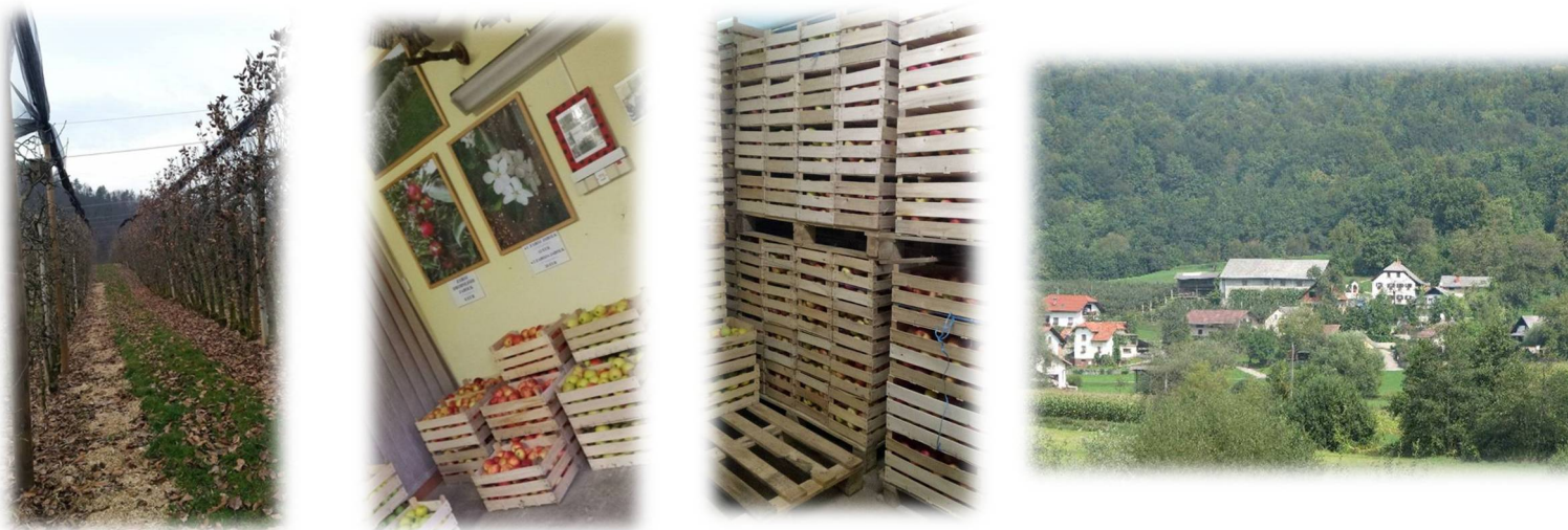
Slike 27, 28, 29 in 30: Sadovnjak, Jabolka, pripravljena za prodajo, Jabolka v hladilnici in Kmetija