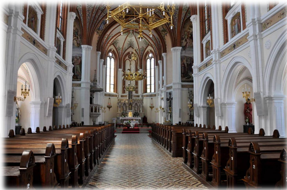
Slika 4: Pogled v notranjost cerkve Sv. Martina

Spoznali bomo tudi legendo o "maravškem mačku", ki je v okolici že dobro znana.