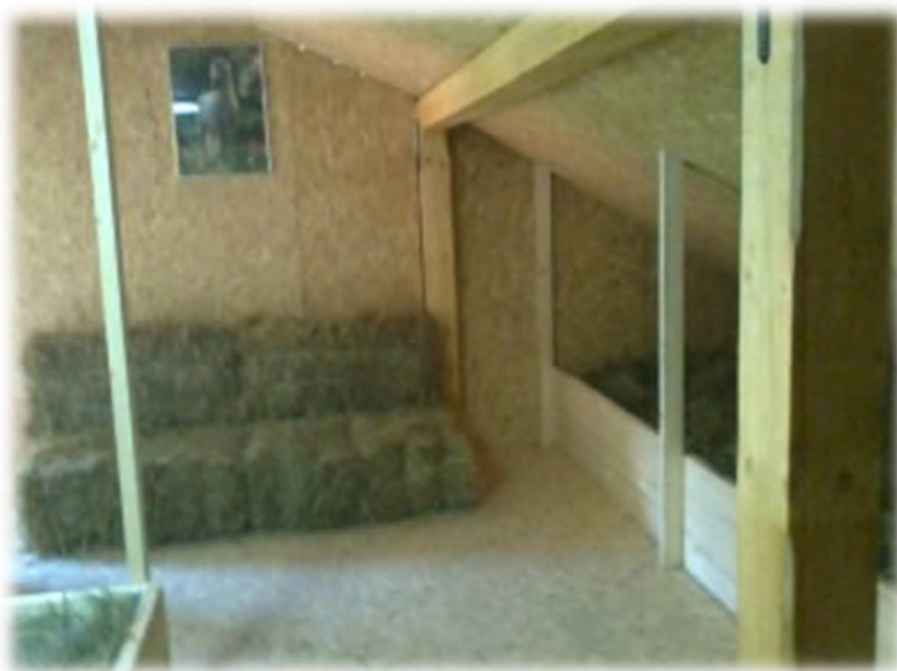
Slika 14: Prostor v eko hotelu Pr'Oslet