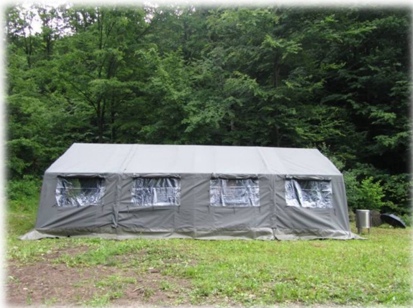
Slika 38: Skavtski šotor

Po opravljenem ogledu kmetij in njihovih dejavnosti se bomo odpravili k ribnikom v Zalogu, nad katerimi so taborniki postavili kočo. V njej so sanitarije, tuši in prostor za kuhanje. Pri skavtih bomo sposodili šotore in ostalo opremo, potrebno za prenočevanje. Pomagali nam bodo postaviti šotore in po večerji bomo izvedli športne in/ali namizne igre.