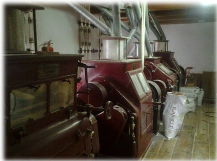
in 19: Notranjost mlina