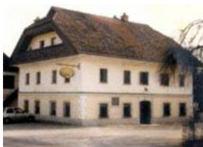
Slika 1: gostilna Frfrav

Na kmetiji in gostilni se je zamenjalo veliko dobrih gospodarjev. Leta 1965 pa so začele korenite spremembe v napredku. Najprej je bil na novo zgrajen hlev za govedo, potem obnova in nadgradnja stare hiše (gostilne). Leta 1985 pa izgradnja novega gostinskega objekta na mestu bivšega furmanskega hleva. Gradnja objekta je trajala več let, a sedaj ko je končan sprejme do 150 gostov. Zadnja leta so obnovili hlev za prašiče in dogradili klavnico s trgovino. Tako kot njihovi predniki se tudi zdajšnja generacija trudi ustreči gostom, ki jih obiščejo.