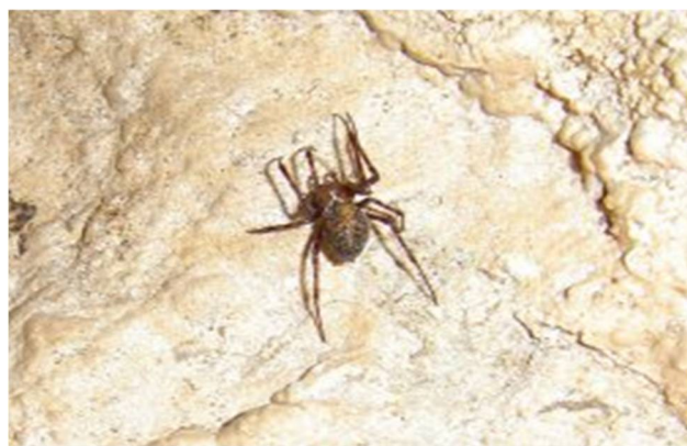
Rjavi jamski pajek