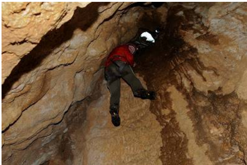
Vhodni rov v jamo