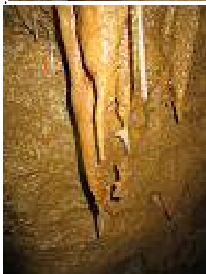
Kapnik v jami