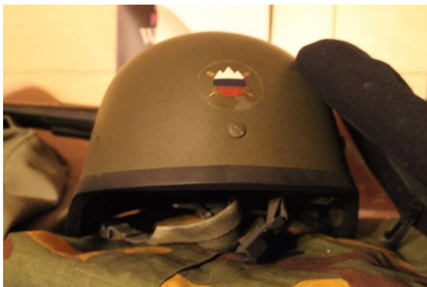
Slika 15 Čelada slovenskih vojakov iz osamosvojitvene vojne