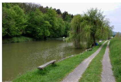
Slika 15 in 16 Ribnik II. In I. v Zalogu