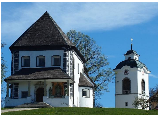
Slika 23 Glavni oltar v cerkvi sv. Valentina

Čas izdelave prve cerkve bi lahko povezali z gradnjo gradu, vendar o tem ni nobenih trdnih podatkov.