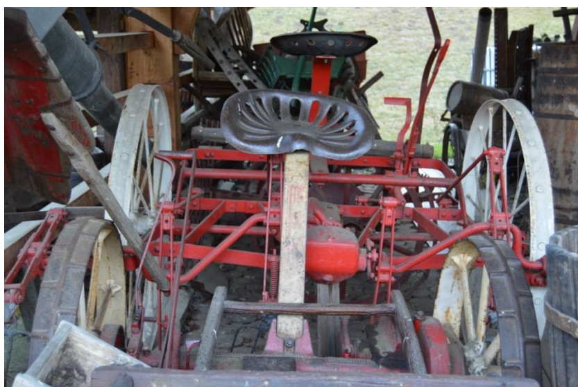
Slika 4 Kosilnica

Če je bil voz lep in čist, se je uporabljal za prevažanje krompirja. Voz na sliki je star, saj je še iz lesa in je pleten. Vozili so jih s pomočjo konjev, še pogosteje krav.