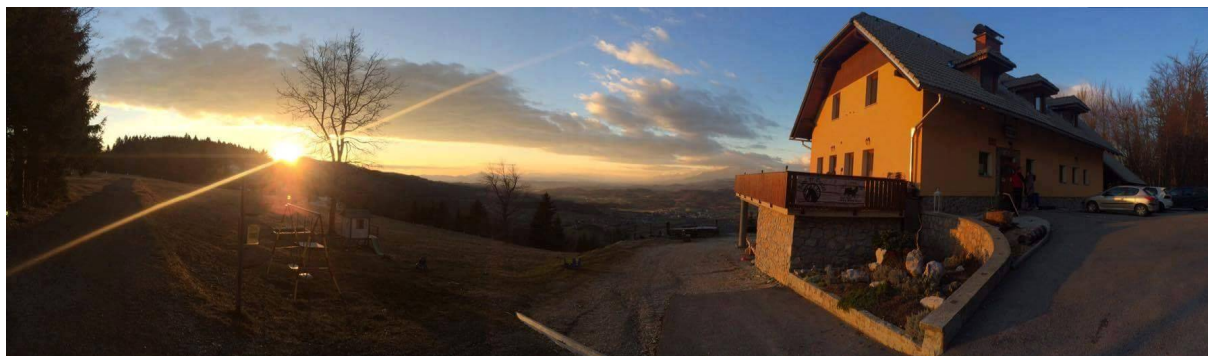
Slika 27 Planinski dom Ušte

Sledi zaključek na Planinskem domu Ušte, kjer imajo kosilo. Oskrbnik doma uporablja lokalno in ekološko pridelana živila okoliških kmetov.