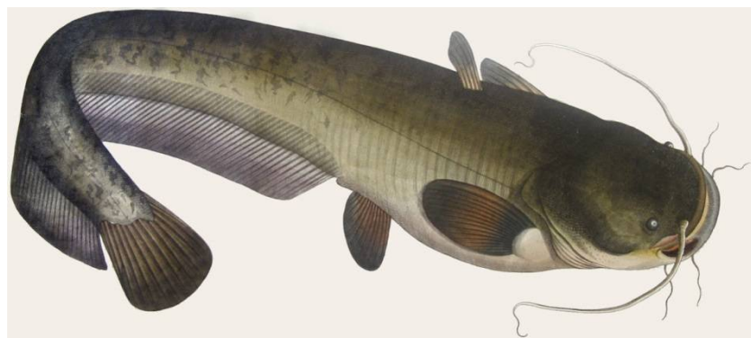
Slika 21 Som