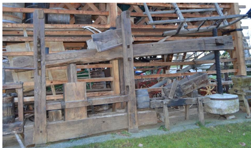
Slika 8 Plug

Po navadi so bili leseni. Tale je star okoli 30 let. V njega so dali sadje, nato so zavrteli kolo in zobniki so mleli sadje, ki so ga nato prestavili v stiskalnico in stisnili sok (tolkovec).