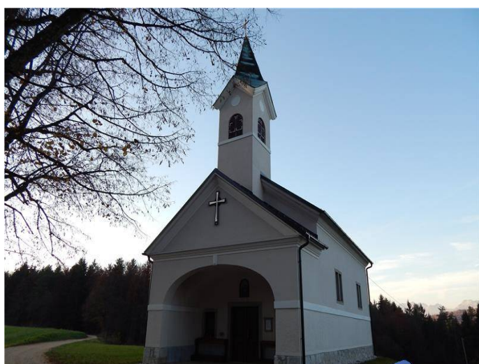
Slika 1 Cerkev Žalostne matere Božje na Hribcah

Načrte je izdelal msgr. Josip Dostal. Do zime je bila stavba pod streho. Ivan Pengov iz Ljubljane je izdelal oltar in prenovil kip Žalostne Marije. Akademski slikar Izidor Mole je naslikal 4 oljne slike na platno. Pritrjene so na podstavku in se lepo skladajo tudi z novimi freskami. Na oltarju je naslikanih sedem Marijinih žalosti. Vsako leto je tam slovesna maša 15. avgusta, na praznik Marijinega vnebovzvetja, po želji pa je lahko tam tudi poroka. Cerkev je bila v celoti obnovljena pred dvema letoma. .