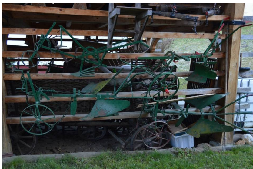
Slika 10 Novejši plug, v celoti kovinski

Po domače šrotar se je uporabljal za mletje koruze. Poznali so lesene, ki so bili starejši in pa seveda železne. Na sliki je malo novejši, star je okoli 50 let.