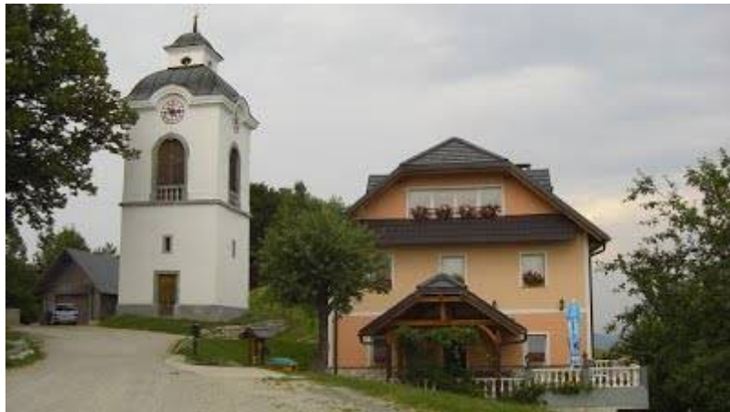
Slika 22 Gostišče Urankar na Limbarski Gori, levo zvonik cerkve, ki stoji ločeno od cerkvene stavbe

Vrnejo se nazaj do makadamske poti ob Drtijiščici, vendar tokrat zavijejo desno, proti Serjučam. Od tam nadaljujejo pot proti Limbarski gori. Na Limbarski gori imamo dogovorjeno kosilo v gostilni Urankar.