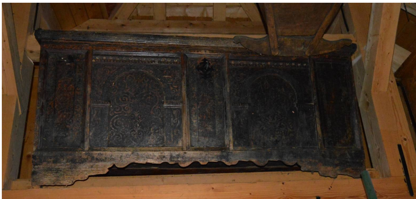
Slika 14 Skrinja za oblačila