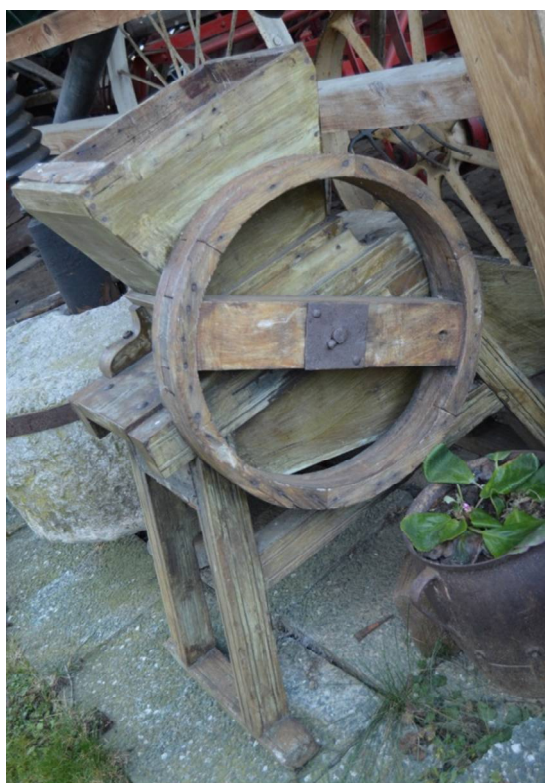
Slika 7 Še en mlin za sadje

Po navadi so bili leseni. Tale je star okoli 30 let. V njega so dali sadje, nato so zavrteli kolo in zobniki so mleli sadje, ki so ga nato prestavili v stiskalnico in stisnili sok (tolkovec).