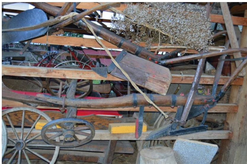
Slika 9 Še en plug