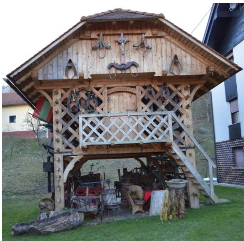
Slika 2 Nemčev kozolec na Javoršici

Lastnik Miroslav Nemeč pripoveduje, da je kozolec začel graditi leta 2002, staro kmečko orodje pa je zbiral že prej. Zbiral je za dušo, zaradi veselja in da bi ohranjal stare običaje in kmečka orodja.