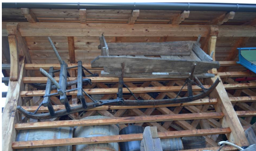
Slika 12 Sani

Ko še niso poznali avtov in drugih prevoznih sredstev, so pozimi uporabljali sani. Tako so prihajale iz enega konca do drugega in tako so tudi prevažali drva. Po navadi so bili vpreženi konji.