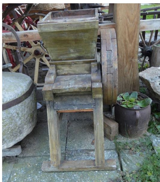
Slika 6 Mlin za sadje

Stiskalnica ali po domače »preša« se je uporabljajo za delanje mošta (sok grozdja). Prva in najnovejša je stara okoli 30 let. Druga in s tem tudi malce starejša je stara okoli 40 let. Tretja, ki pa je najstarejša pa je stara okoli 100 let.