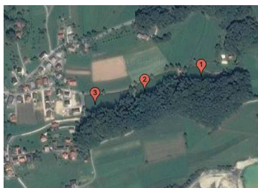
Slika 17 in 18 Ribnik III. V Zalogu