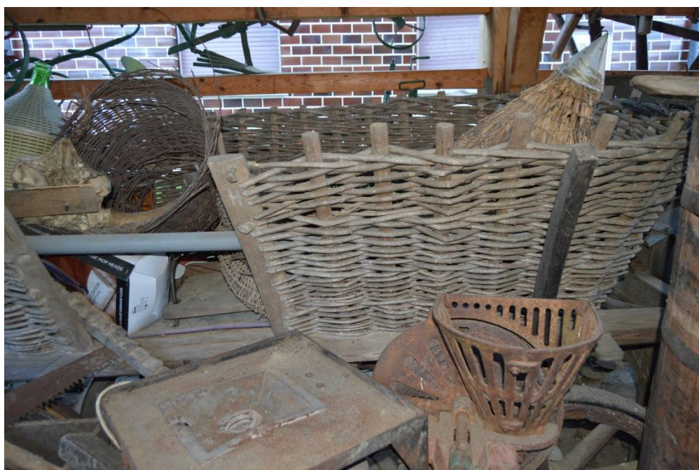
Slika 3 Voz za krompir

Če je bil voz lep in čist, se je uporabljal za prevažanje krompirja. Voz na sliki je star, saj je še iz lesa in je pleten. Vozili so jih s pomočjo konjev, še pogosteje krav.