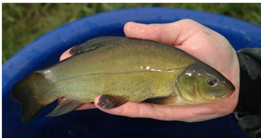
Slika 20 Linj