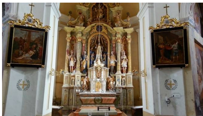
Slika 24 Cerkev sv. Valentina

Prisluhnejo tudi legendi o princesi Liliji.