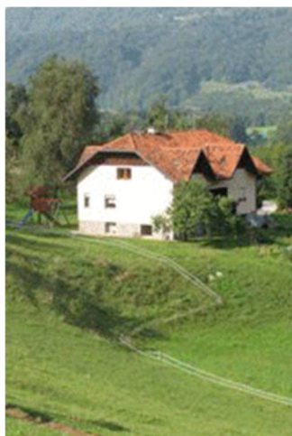
Slika 25 Kmetija Pirc

Na tem mestu, kjer danes stoji Pirčeva domačija, se je včasih nahajala stara hiša, ki je bila graščina. O njeni zgodovini se lahko prepričate v knjigi Moravska dolina. Ker mimo hiše pelje pot, se pohodniki radi ustavijo pri njih, kjer kupijo domače izdelke, kot so zeliščni in sadni likerji. Ponosno vam bodo predstavili tudi ohranjene stare sorte jabolk in hrušk. Poleg govedoreje in pridobivanja mleka izdelujejo tudi skuto, za katero pa trenutno še pridobivajo certifikat. Razgled vas bo očaral, saj se iz njihove domačije vidijo Kamniško-Savinjske Alpe, Limbarska gora in severno-vzhodna stran Čemšeniške planine.