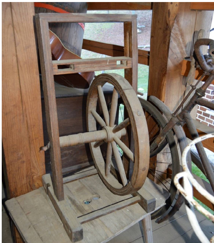
Slika 13 Kolovrat

Kolovrat so uporabljali za predenje niti. Predilec je z roko poganjal kolo, vrtelo se je pa le vreteno, ki je vrtelo vlakna in iz njih predlo nit. Sedaj to vse počnejo strojno.