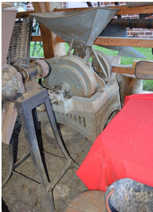
Slika 11 Šrotar