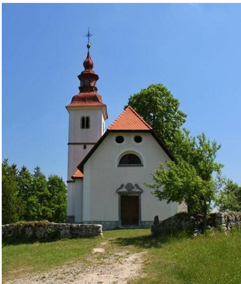
Slika 26 Cerkev sv. Florjana v Gori pri Pečah