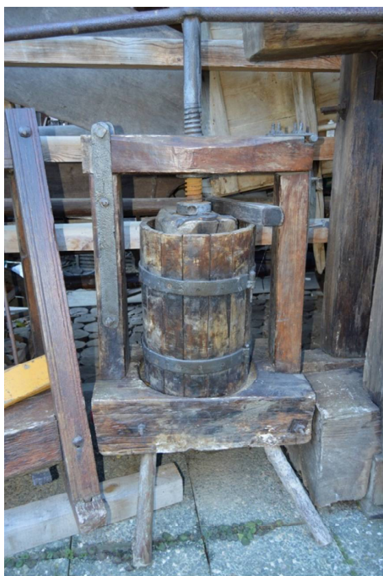
Slika 5 Stiskalnica za sadje

Stiskalnica ali po domače »preša« se je uporabljajo za delanje mošta (sok grozdja). Prva in najnovejša je stara okoli 30 let. Druga in s tem tudi malce starejša je stara okoli 40 let. Tretja, ki pa je najstarejša pa je stara okoli 100 let.