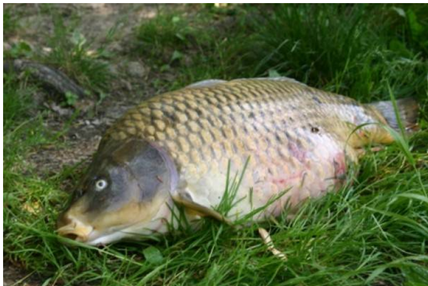
Slika 19 Krap

V ribnikih najdemo naslednje vrste rib: krapa, linja, soma in smuča. Pri ribniku nas pričaka ribič Uroš Avbelj, ki nam predstavi osnovno opremo ribičev in pokaže različen vabe ter načine muharjenja.