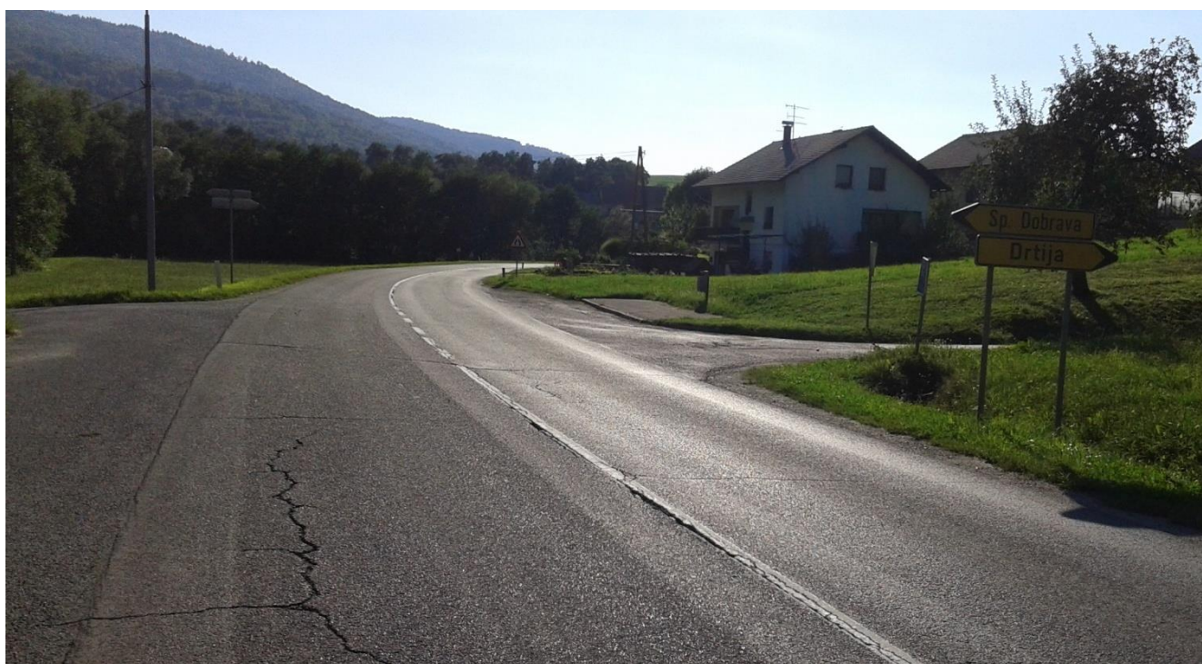
Drtija, avtobusna postaja (ni prehoda za pešce)